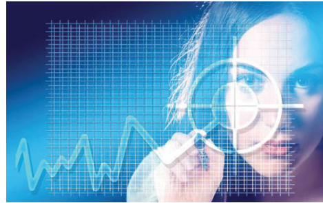
Ein genauer Blick kann helfen, Krisen frühzeitig vorzubeugen.

Die Untersuchung im Rahmen des Business Review reicht fallweise bis tief in die