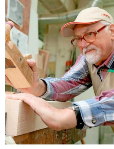
Wer den Meister macht, bekommt bald ein höheres Meister-Bafög.

BERLIN. Das Bundeskabinett hat einen Gesetzentwurf für das neue Meister-Bafög beschlossen. Vorgesehen sind zahlreiche Leistungsverbesserungen. So soll der maximale Unterhaltsbeitrag für Alleinstehende um 71 Euro auf 768 Euro steigen. (hos)