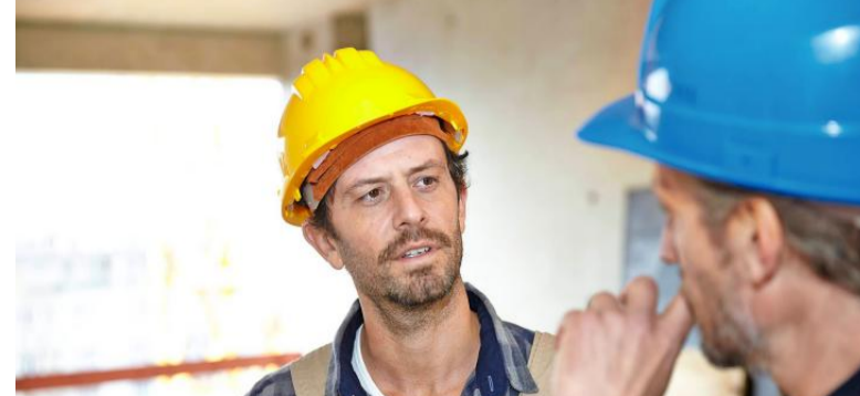
Architekten und Bauingenieure gehören zu den Gruppen, die häufig als Werkvertragnehmer arbeiten.

Derzeit schließen in Deutschland etwa 900 000 Selbstständige im Haupterwerb Werkverträge ab – 2,1 Prozent aller Erwerbstätigen. Für die Unternehmen seien sie aber sehr wichtig, vor allem wenn es um Einmalaufgaben und Arbeitsspitzen gehe, etwa um die Einführung oder Anpassung neuer Software. Der typische Werkvertragnehmer ist laut IW männlich (76 Prozent) und 30 bis 50 Jahre alt (62 Prozent). Rund 17 Prozent der Werkvertragnehmer gehören zur Gruppe der Unternehmensberater und Anwälte, 15 Prozent sind Architekten, Bauingenieure oder Informatiker. Weitere zwölf Prozent gehören zur Gruppe der Klempner, Fliesenleger und Bauelektriker. (hos)