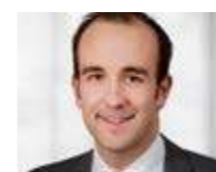
→ Christian Glaser www.wuerth-leasing.de