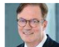
→ Robert Buchalik www.bv-esug.de