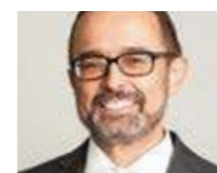
→ Carsten Gehring www.tetental.com