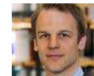
→ Dr. Stefan Kroll www.hsfk.de