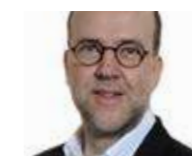
→ Peter E. Rasenberger www.grantiro.at